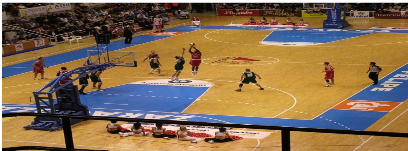
Partida de basquetebol

Atualmente, o basquetebol é um dos jogos olímpicos mais populares no mundo. Nas escolas, é um dos esportes mais praticados nas aulas de educação física.