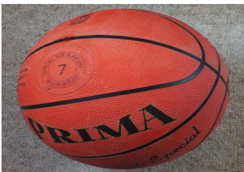
Bola de basquetebol

Curioso notar que no início o esporte era praticado com uma bola semelhante à de futebol. Somente em 1984 que a bola de basquete, tal qual conhecemos hoje, foi desenvolvida por uma empresa de Massachusetts.