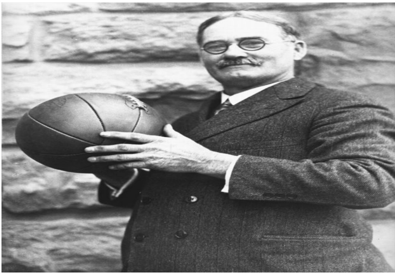
James Naismith, o fundador do basquetebol

O esporte surgiu como uma alternativa ao inverno rigoroso da região, em detrimento dos outros praticados ao ar livre como o baseball e o futebol.