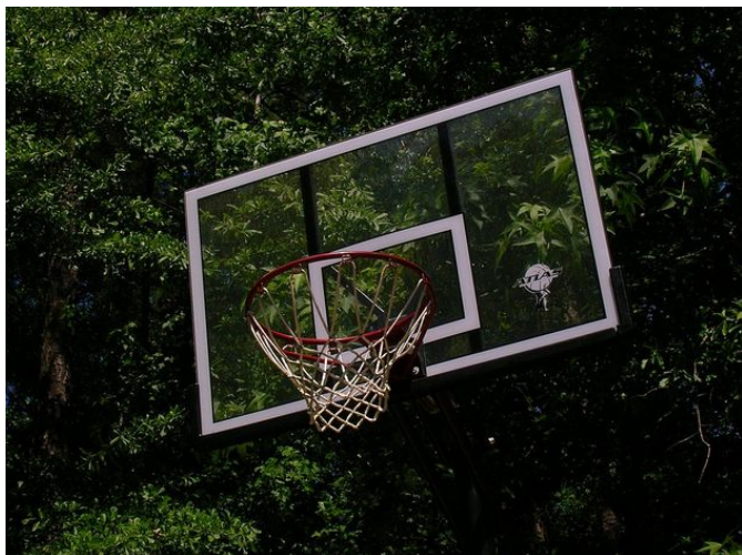
Tabela de basquetebol

O basquetebol tem como objetivo inserir a bola no cesto correspondente à sua equipe. Portanto, há dois cestos em cada extremidade de quadra a 3,05 metros do chão. O local onde está o cesto é chamado de tabela .